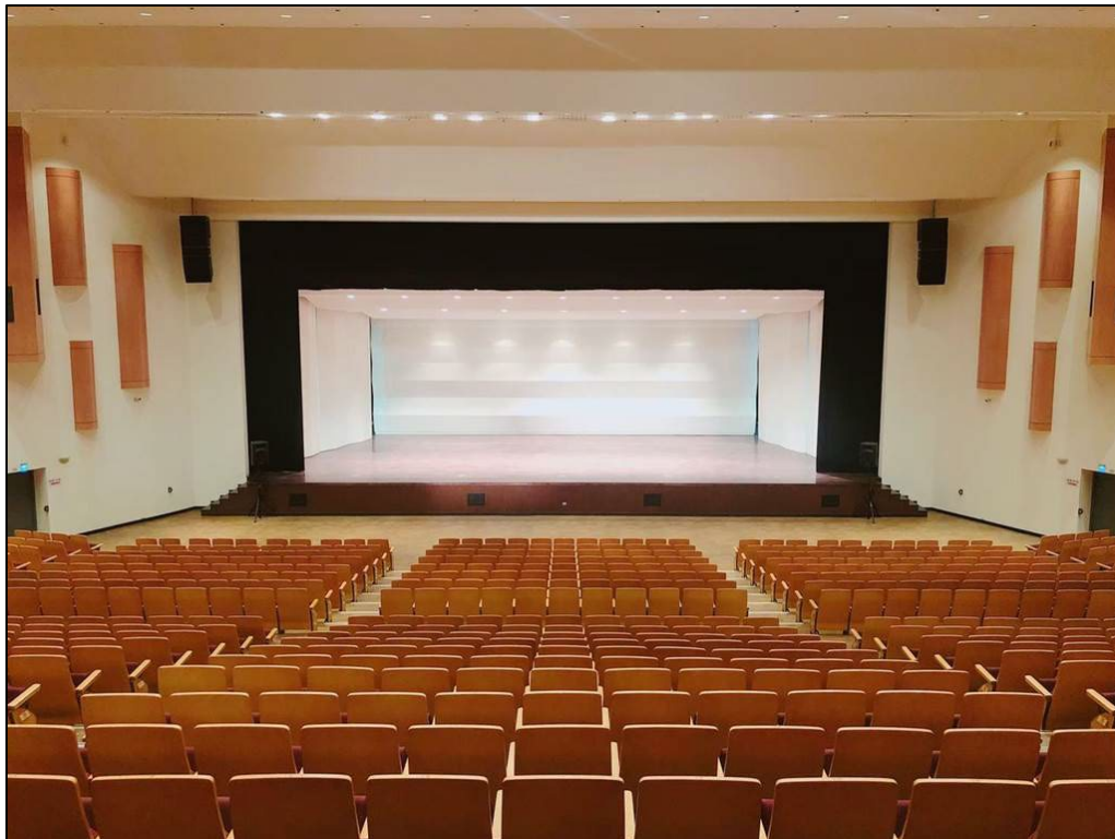
中壢藝術館音樂廳 為鏡框式舞台